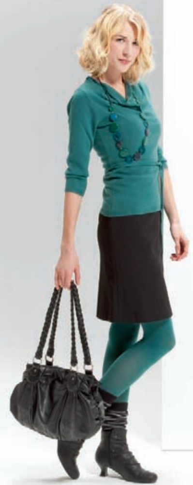
VenoTrain® micro – Oliv

Die feine Rippstruktur des VenoTrain business entspricht dem klassischen Stil von Herrenstrümpfen, ebenso wie das gedeckte Farbsortiment und der innenseitige Baumwollanteil. Der breite Abschlussbund und die antimikrobiell wirksame Fußsohle sorgen für hohen Tragekomfort.