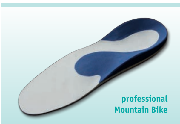
professional Mountain Bike