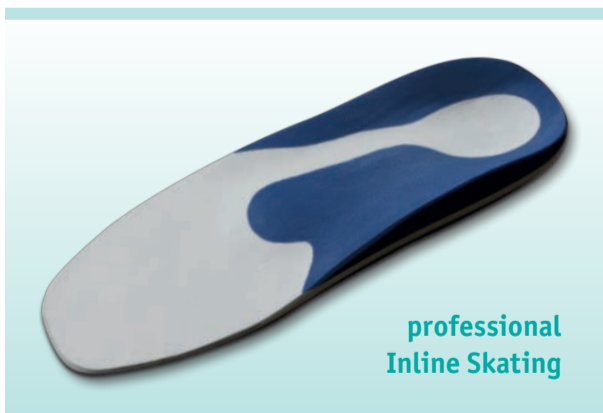
professional Inline Skating