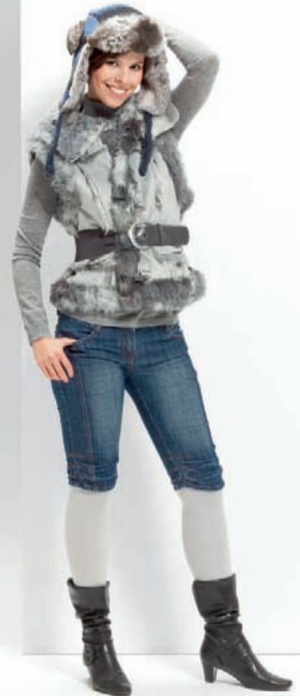
VenoTrain® micro – Stone