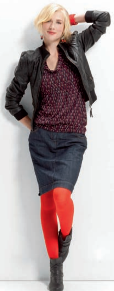
VenoTrain® micro – Chili